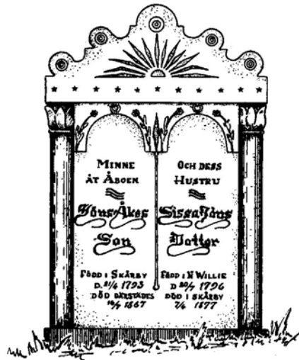
Den äldsta bevarade minnesvården i slätten befintlig å Glärbý kyrkogård.